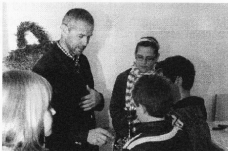
Spiel & Spaß kommen nicht zu kurz.

Minis: Seit Oktober 2010 haben wir regelmäßige MinistrantInnenstunden. Neben dem Einüben liturgischer Abläufe lesen und besprechen wir auch Bibelstellen.