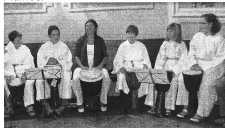
Pfingstrap mit den Minis

Weitere Bilder gemeinsamer Aktivitäten der Minis können Sie im Internet unter http://pfarre.kirche.at/brunnkirchen/content/ministranten ansehen.