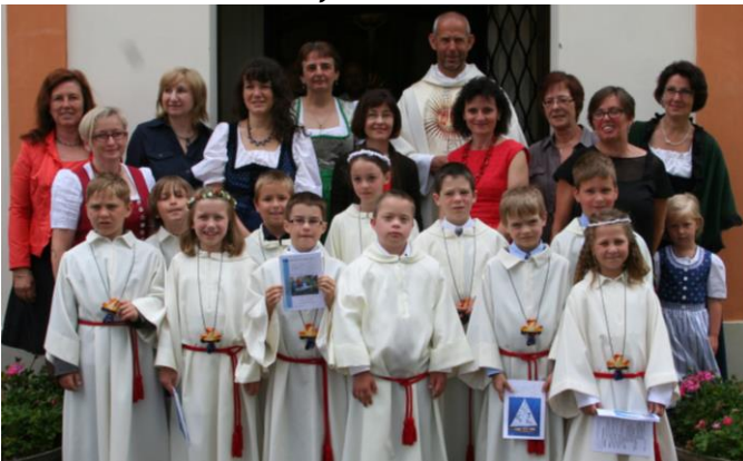
Erstkommunion, 15. Juni