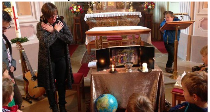
Bibelstunde, 5. Oktober