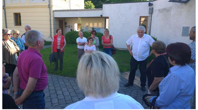
Besuch in der Pfarre Paudorf, 7. Juni