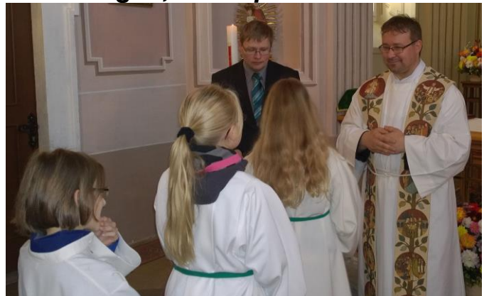
Primizsegen, 28. September