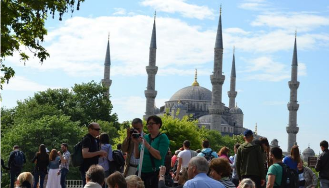
Pfarr-Reise nach Istanbul, 1.- 4. Mai