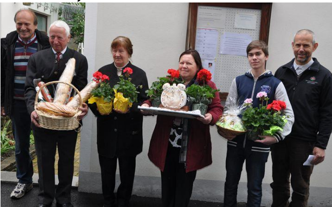
Pfarrfest, 18. Mai