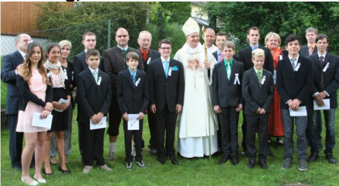
Firmung, 31. Mai